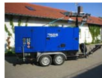
40 KVA / Lima